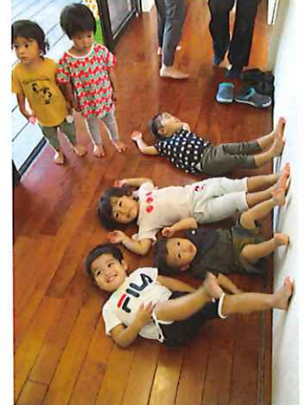
↑気温が下がり廊下も気持ちいい〜思わず寝転がる子どもたち