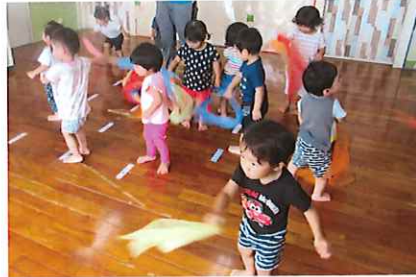
さおり先生が産休から復帰してリトミックも再開しました！