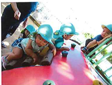
同級生や他のクラスの友達と関わりを持ちながら遊んでいます！