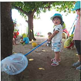
虫探しに勤しんだ9月後半。なかなか捕まりませんが、先生や上級生が捕まえてくれた虫を観察しました。