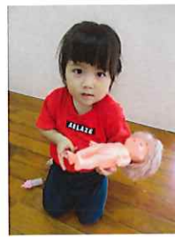
室内遊びでは→メルちゃんが大人気です！