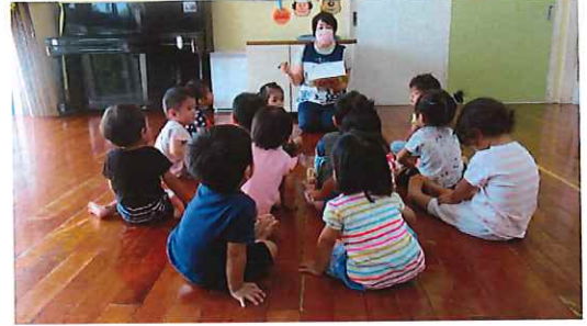
運動会に向けて自分のマークに並ぶ練習をしています！ かなり上手になりました。

緊急事態宣言がやっと明けましたね！ 数ヶ月ぶりに14名が揃い、担任たちも「やっと今までの日常が戻ってきた〜！」と嬉しく思っています。 特別保育期間中の家庭保育のご協力、本当にありがとうございました！ あっという間に夏が終わってしまい、気がつけば風が涼しい季節になってきています。外遊びをしても汗をかかないくらいに過ごしやすく、子どもたちものびのびと過ごすことができますよ♪ 夏の間みんなで過ごせなかった楽しい時間を、これから14名の子どもたちとたくさん過ごしていきたいと思ひます。