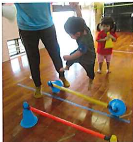
←運動会の親子競技はフープくぐりとハードルです！