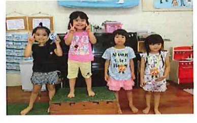
宝探し(ひなた・ゆうな・つばき・りるか)