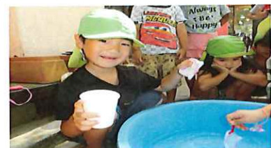
金魚すくい競争(そらん・さら・うみ・るあと)