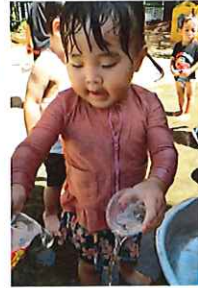
お水あそび大好きなはと組の子どもたち。初めはちょっぴり嫌がっていた子も後半になるとずぶ濡れです(笑)かけたりかけられたりも楽しみの一つ。