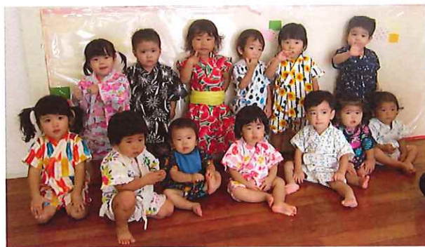
七夕祭り♡基平にテンションupの子どもたちでした

8月に入ってから風が気持ちいい日が続いています。 さて、夏になって水あそびの季節がやってきました！ 水が本当に大好きな子どもたち。水あそびが始まった途端 大興奮で水をすくったりこぼしたりして楽しんでますよ♪ 7月後半ははと組で全体的に体調不良が続きました。 外遊びを早めに切り上げたり、室内でゆったり過ごしたりと 子どもたちの様子を見ながらの保育となりました。 8月は元気に外遊びや水遊びができますように。 鼻水や咳などの風邪症状がある場合は、可能な限り早めに 休憩時間を取ってあげてくださいね。 園でも室内の消毒や換気にも気をつけていきます。