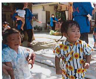
たなばた会ちょっとはと組さんには暑かったかな～。