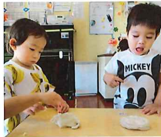
小麦粉粘土、またやろうね^^今度は色もつけたいと思います。