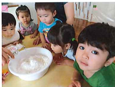
小麦粉と水が混ざるとどうなるの？興味津々の子どもたちです。